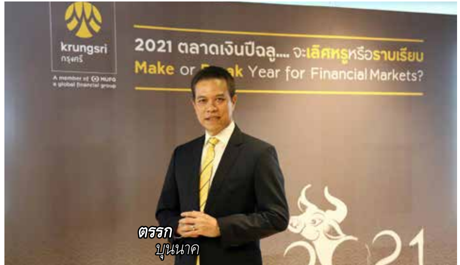
ตรรก บุนนาค

นอกจากนี้ธนาคารกลางทั่วโลกมีแนวโน้มคงดอกเบี้ยนโยบายในระดับต่ำต่อเนื่อง รวมทั้ง